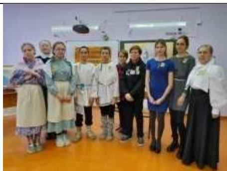
Дореволюционная школа (Дудовка)