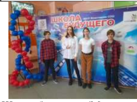
Школа будущего (Момотово)