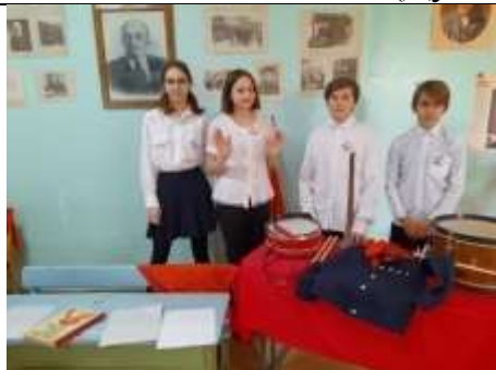
Довоенный период (Казачинское)