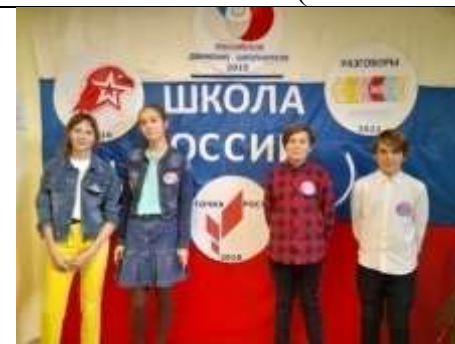
Современная школа (Рождественское)